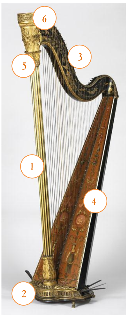
Harpe à pédales, fin XVIII e siècle, France. MAD 1505